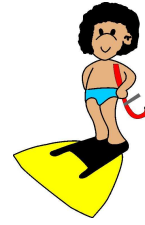
Nuoto Pinnato Tarvisium ASD - Treviso