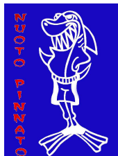
Aquarea ASD - Vicenza