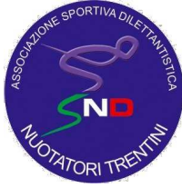
SND Nuotatori Trentini ASD -Trento