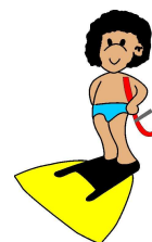
Nuoto Pinnato Tarvisium ASD - Treviso

Il Presidente della Società, con l'iscrizione alla manifestazione, dichiara sotto la propria responsabilità che tutti gli atleti, giudici, tecnici e dirigenti tesserati con la propria Società partecipano alle attività sportive ed alla manifestazione organizzata in forma spontanea e senza alcun vincolo e obbligo di partecipazione in quanto organizzata in forma dilettantistica e di svago, dichiarando altresì, che tutti i tesserati si impegnano a non chiedere il risarcimento dei danni al comitato Organizzatore per infortuni non rimborsati dalla Società di assicurazione. Dichiara inoltre, in base al consenso scritto validamente prestato da parte dei propri Soci, ai sensi dell'art. 13 della legge n. 196/2003, di autorizzare il Comitato Organizzatore ad utilizzare e gestire, per i suoi fini istituzionali e per gli scopi che riterrà più opportuni nell'ambito della propria attività, nominativi, foto, video ed immagini ottenute durante lo svolgimento delle manifestazioni, sempre nel rispetto dell'immagine e dell'interesse dei partecipanti, escludendo qualsiasi forma di cessione a terzi o di distribuzione o di commercializzazione delle immagini.