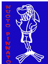
Aquarea ASD - Vicenza