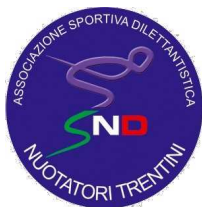
SND Nuotatori Trentini ASD -Trento